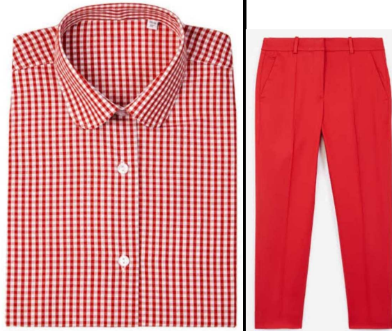
Shamba dress (Vazi la kazi)

Rangi : Bluu bahari(Light blue) Tai rangi ya blue yenye mistari myeupe